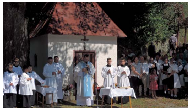
Svätá omša Pod Suchou 15. septembra 2020.