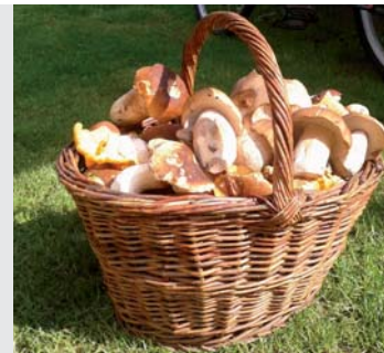
Jeseň bola bohatá nielen pre hubárov, ale po dlhšom čase bolo dostatok aj lieskových orechov.