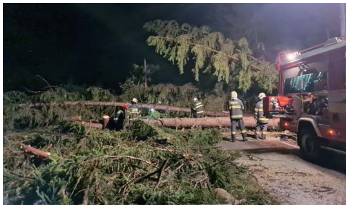
Hasiči z Papradna zasahovali 30. augusta pri odstraňovaní strojov po veternej kalamite pod Ostravicami.