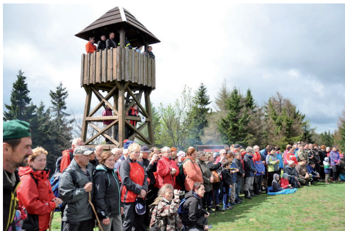
Oslavy pri Troch krížoch na Stratenci pred pár rokmi.