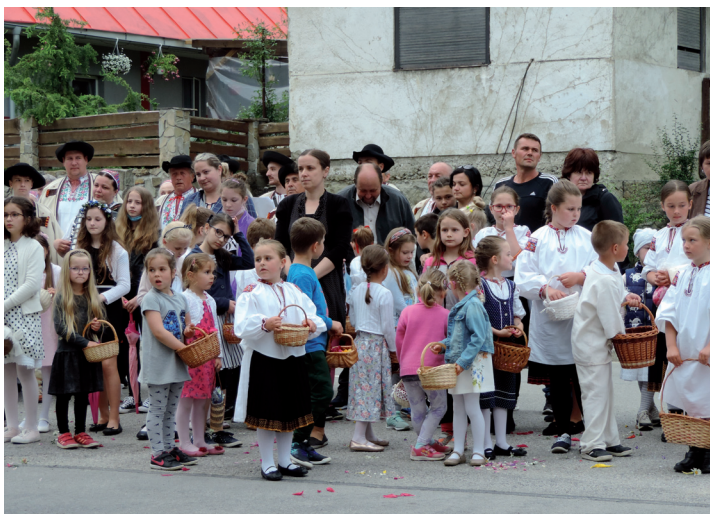
Deti z Papradna a Brvništa s košíčkami lupienkov kvetov sa zúčastnili na „posýpke“ slávnosti Najsvätejšieho Kristovho Tela a Krvi. Procesia začínala od amfiteátra ku kostolu.