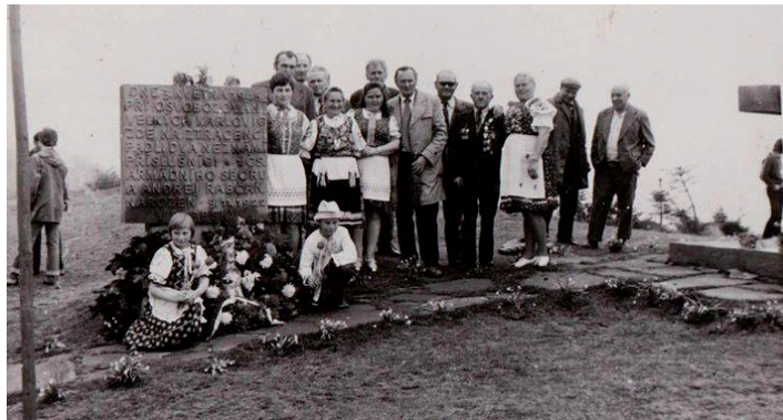
Oslavy pri Troch krížoch na Stratenci začiatkom 80. rokov 20. storočia.

Každý rok sa na Stratenci pri Troch krížoch v Javorníkoch konajú medzinárodné stretnutia Moravákov a Slovákov, aby si pripomenuli udalosti z konca 2. svetovej vojny a aby si uctili pamiatku padlých vojakov, ktorí bojovali za našu slobodu.