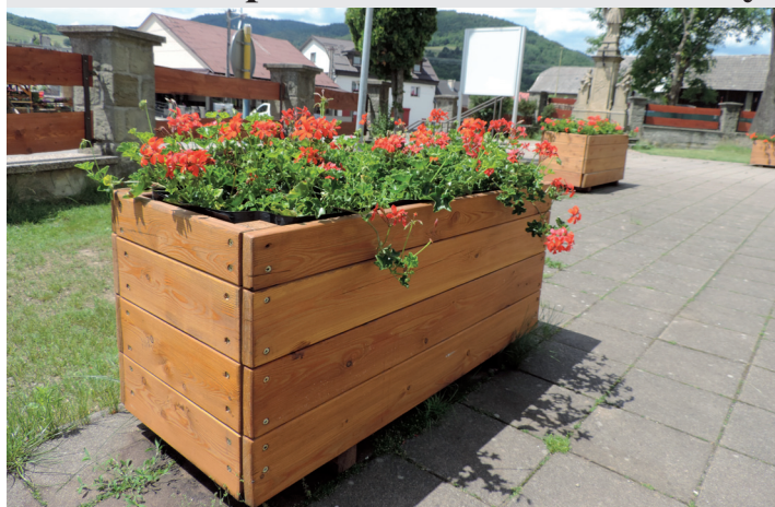
Od mája zdobia priestranstvo okolo kostola kvetinové záhony s muškátmi.