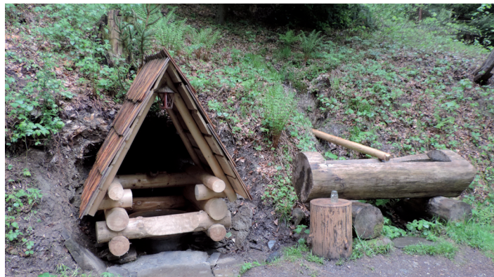
Opravená studnička na Křžli.