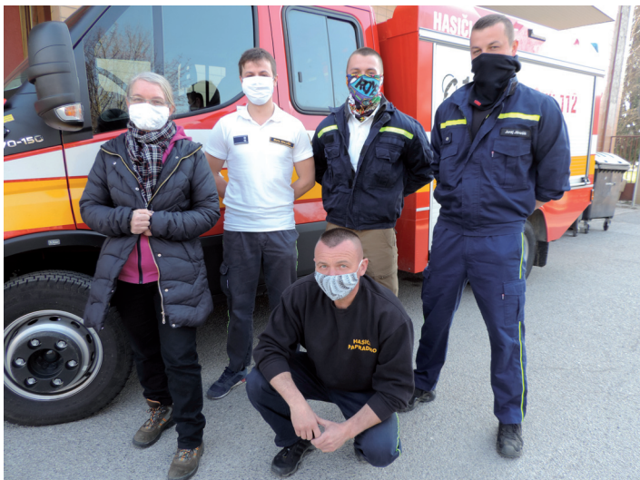
Členovia Dobrovoľného hasičského zboru a pracovníci OÚ Papradno v apríli darovali krv na hematologicko-transfúznom oddelení NaSP v Považskej Bystrici.