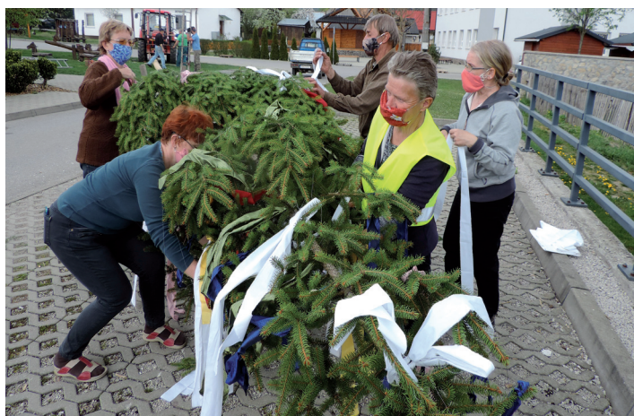
Stavanie mája pred KD bolo s rúškami na tvári.

Ďakujem všetkým občanom, ktorí sa starajú a vykášajú nielen svoje záhradky, ale aj plochy okolo plotov, rieky a pod. Aj vďaka takýmto ochotným občanom je naša obec krajšia. (ap)