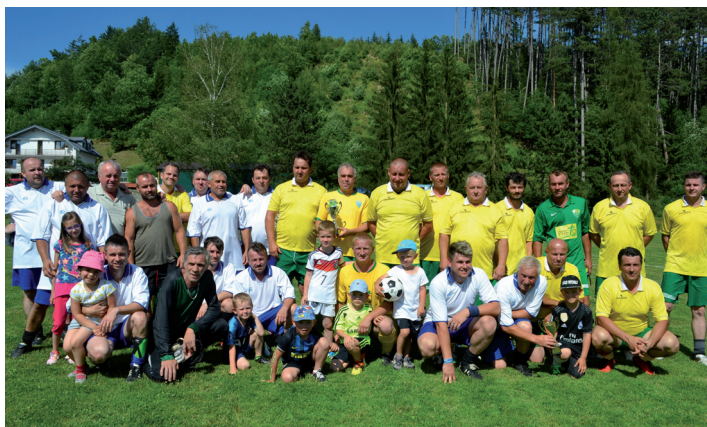
Starí páni TJ Papradno a TJ Brvnište

Vydavateľ: Obec Papradno, 018 13 Papradno č. 315, IČO:00317594. Redakčná rada: Ing.Věra Lališová, e-mail: viera.lalisova@csspapradno.sk, Ing. Anna Pozníková, Mgr. Denisa Macošincová, Mgr. Margita Bulíková. e-mail: papradno@papradno.sk. Príprava pre tlač: Viera Petříková. Tlač: PNprint, Piešťany. Náklad: 1 100 výtlačkov. Povolené Okresným úradom Považská Bystrica, odbor všeobecnej vnútornej správy. Reg. číslo: EV 3232/09, ISSN 1338-8037. Cena výtlačku: bezplatne.