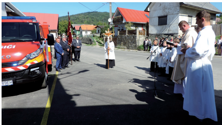
Požehnanie novej hasičskej techniky.

Ďakujeme nášmu pánovi farárovi za rozhovor a želáme mu veľa síl v uskutočňovaní svojich plánov a predsavzatí i veľa Božej pomoci. Nezabúdajme, že aj my máme pomáhať v budovaní našej farnosti – modlitbami aj svojou prácou. (ap)