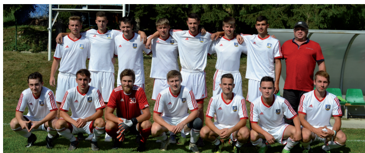
TJ Slovan Brvnište