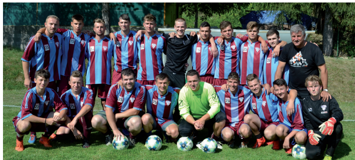
TJ Žiar Papradno