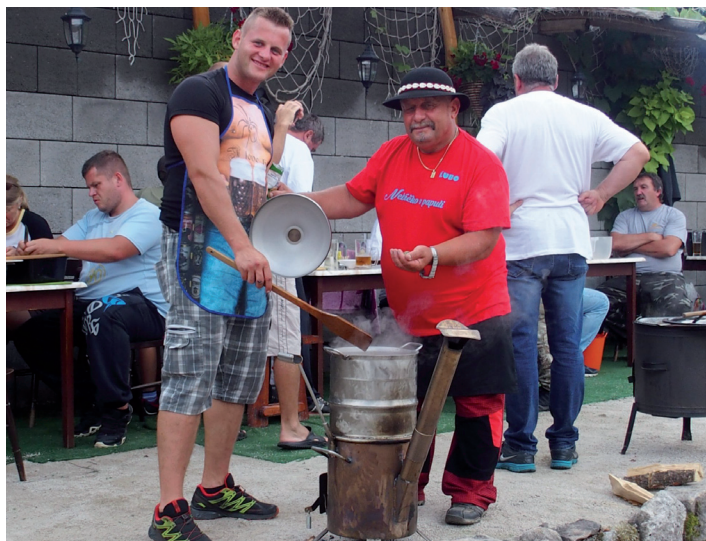
Varenie kotlíkových špecialít v pohostinstve Dalas.

Ďakujeme zamestnancom Dalasu, všetkým, čo v sobotu 11. augusta varili v Dalase kotlíkové špeciality, starostovi, poslancom i tým, ktorí si zakúpili tombolu, za podporu materskej školy. Ich obetavou prácou sme pre naše detičky získali 762 €. Za peniaze zakúpime deťom hračky a doplnky na nové dopravné ihrisko. Kolektív materskej školy