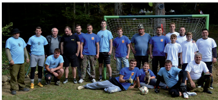
Účastníci II. ročníka futbalového turnaja v Medvedzom.