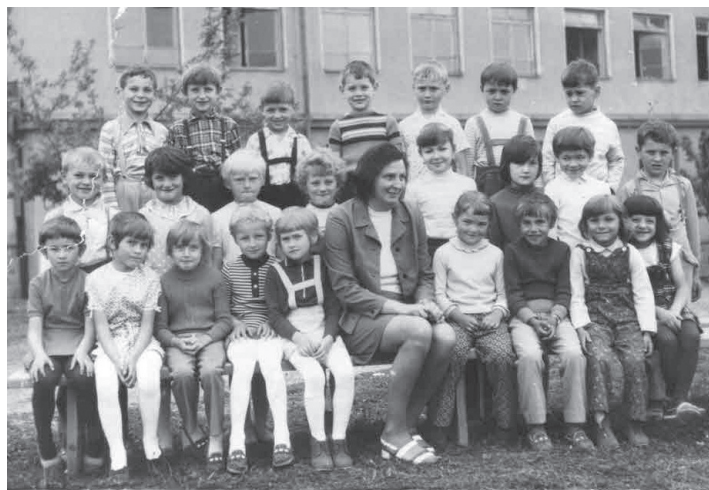
Spomienka na školský rok 1972 – 1973.

Z poobedňajšieho vyučovania sme sa často vracali až potme. Bál som sa ísť sám tmou od