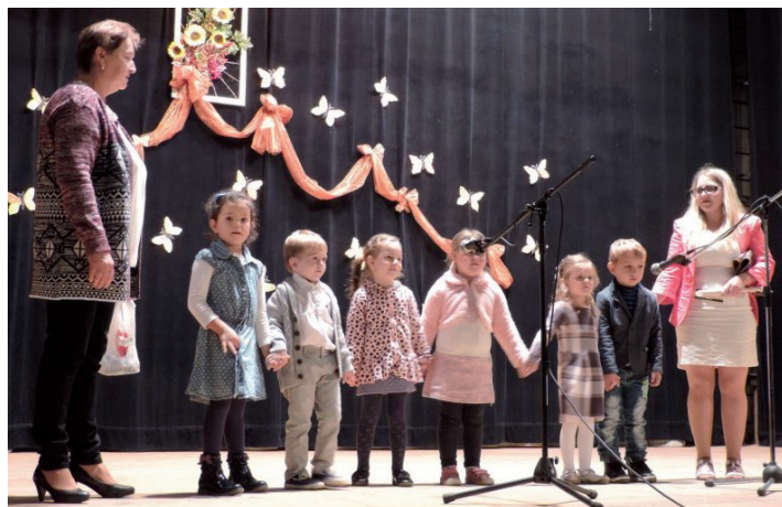
Vystúpenie detí MŠ v októbrovom sviatku úcty k starším.

sa v Papradne začína salašnícka sezóna. Počas tohto veľkonočného víkendú budú na