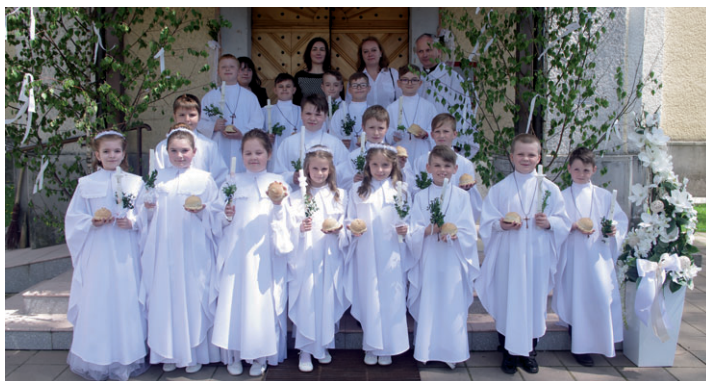
Prvé sväté prijímanie prijalo 14. mája 5 dievčat a 12 chlapcov.