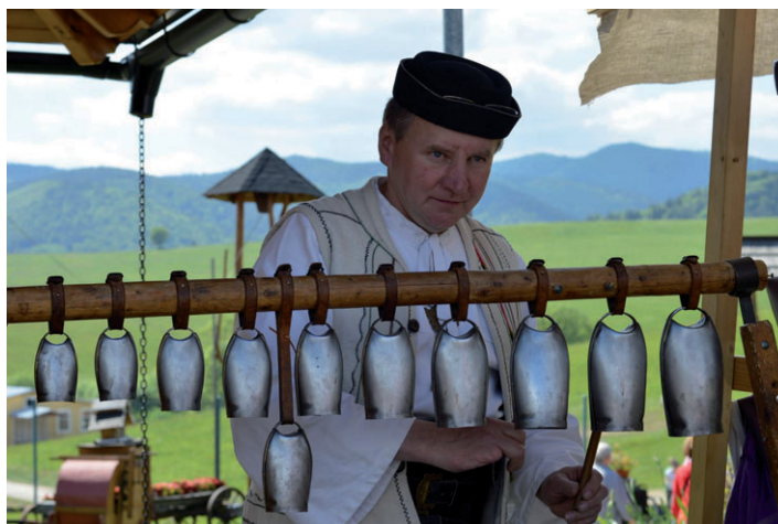
Koliba Papradno - Bačova cesta.