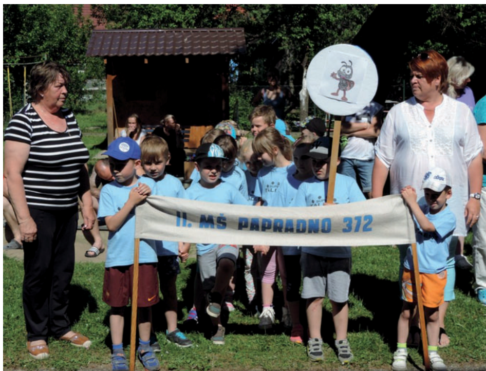
Najmenší oslavujú svoj sviatok športom.

Máme tu opäť prázdninový a dovolenkový čas. Plánujeme oddychové dni pre seba a svoje rodiny či už doma, alebo poznávaním Slovenska, ba i sveta. Nech už budete kdekoľvek, budme takými dovolenkármí, ktorí prinášajú ľuďom úsmev a pokoj. A môžeme aj s hrdosťou pridať, že sme z Papradna. O tom, že máme byť prečo hrdí na svoju obec, svedčí aj toto číslo Polazníka. Máme šikovných ľudí, žiakov a je na nás, aby sme si na ľuďoch všimli viac ich dobré než tie horšie stránky. Ak tak budeme robiť častejšie, verím, že svet okolo nás bude krajší a obohatí to aj nás samých.