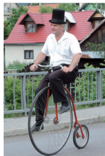
Velocipéd v Papradne počas Veterán tour Manín 2017.