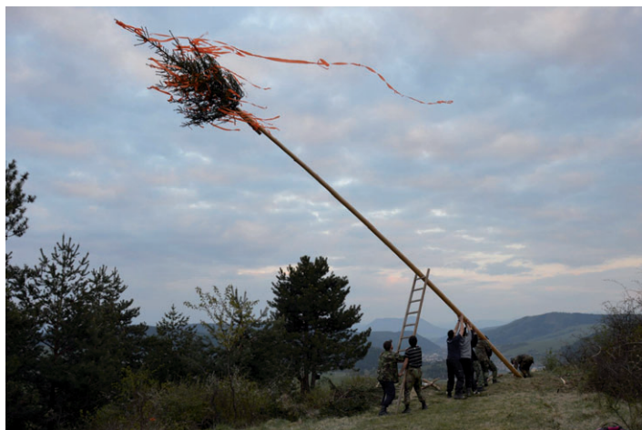
Stavanie mája na Holom vršku.