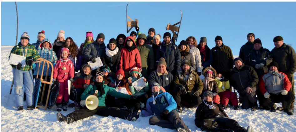
Nulný ročník zimných olympijský hier. Viac na str. 11.

Čas nám všetkým beží stále rýchlejšie. Uvedomili sme si to aj my v redakcii Polazníka. Tento rok vydáme naše obecné noviny už 15. rokom. Boli to krásne aj náročné roky pre nás v redakcii a dúfame, že príjemné čítanie po celý čas pre vás - našich čitateľov. Chceli by sme vás vyzvať, ak si chcete s nami zaspomínať na to, čo vás v novinách potešilo, čo vám možno prekáža, alebo o čom by ste si radi prečítali, napíšte na Obecný úrad Papradno alebo na adresu papradno@papradno.sk. Pri príležitosti 15. výročia vydávania obecných novín Polazník vydáva obec toto číslo vo farbe.