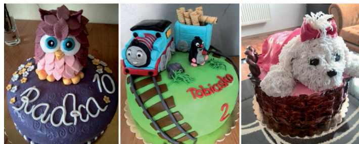
Torty od Renátky Cupanovej