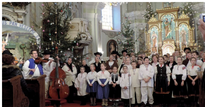
Vianočný koncert „Od Betléma neďaleko“.

Ak máte záujem o DVD z vianočného koncertu, ktorý sa konal koncom decembra v Kostole sv. Ondreja v Papradne, môžete si ho zaobstarať na ZŠ Papradno, príp. každý piatok o 18.00 hod. v skúšobni FSK Podžiaran (v budove KD zozadu – od bytoviek). Podporíte tak činnosť detí z Podžiarančeka. Ďakujeme!