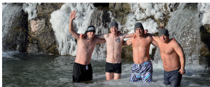
Ľadoví „medvedzi“ 1. januára 2017.