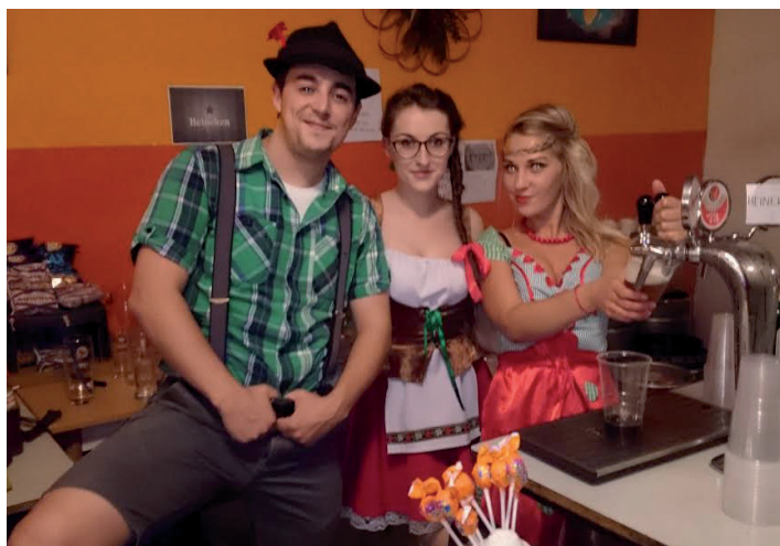
Bavorský deň 1. 10.