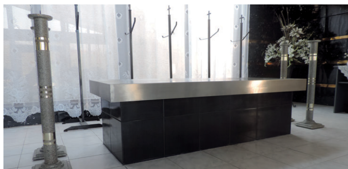
Nový nerezový podstavec pre truhlu (katafalk) v Dome smútku.

Veriaci, ktorí sa dostali do zvláštnych životných situácií, keď sa im rozpadlo manželstvo (či už žijú sami alebo uzavreli nové civilné manželstvo), by v žiadnom prípade nemali strácať spoločenstvo s Cirkvou. Mali by sa naďalej živiť Božím slovom, pra-