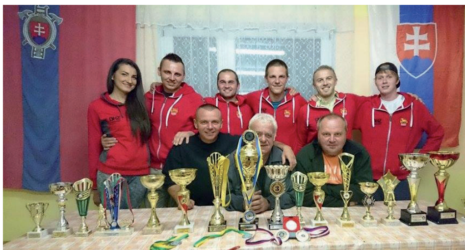
Vítazmi silových hasičských súťaží TFA na Morave sú Papradňanci.

Skúsme sa občas zastaviť a pozrieť sa, čo je v našom živote naozaj dôležité. (ap)