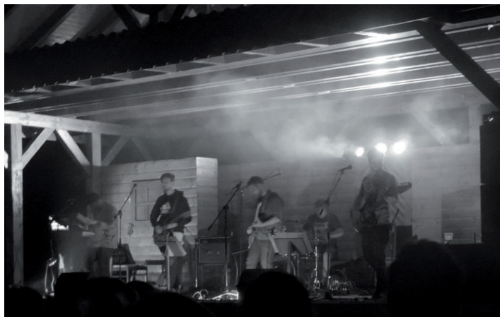
Koncert skupiny The Elections In The Deaftown a BP Band 16. 9.

vedenie Obce Papradno pozýva občanov na spoločné ukončenie roka 2016. Od 22.00 hod. sa budeme pred obecným úradom a amfiteátrom spoločne zabávať. Bude pripravená videoprojekcia, občerstvenie a o hudbu sa postará DJ BO. O polnoci privítame Nový rok ohňostrojom.