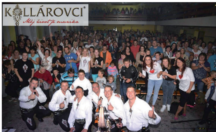
Kollárovcí rozospievali Papradno.