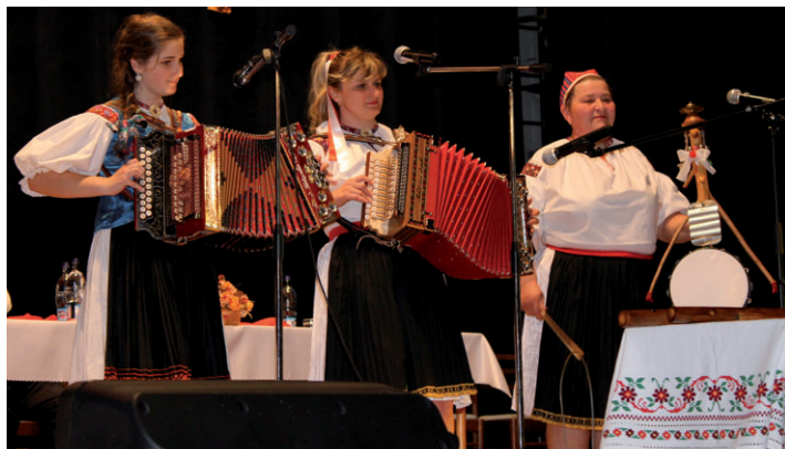
Heligónkarky z Papradna. Vnučka, mama a babka.