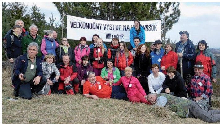
Dňa 27. marca sa uskutočnil VIII. ročník Velkonočného výstupu na Holý vršok.

hotela vľavo popod vleky smerom k Dohánovi. Druhé miesto je cestou k Chuchmákovcom do Harváňkov, tiež asi 1,5 km od hotela. Obidve sú pri stavničke s ohniskom a posedením. Je tam veľmi pekná príroda, ticho. Žblnkot vody dotvára letnú atmosféru prírody. Z oboch miest sa dá pokračovať na Javorníky, ktoré iste všetci poznáte, najmä Strateneč s rozhľadňou, kasárne, či Portáš a Kohútku, kde sa po náročnej túre občerstvíte. Inou možnosťou je prechádzka na Krížel, kde sa vám naskytne čarokrásny pohľad na okolie zahalené krásou. Odtiaľ tiež môžete pokračovať na hrebeň Javorníkov. Možností je veľa. Aj hore už dobre známou Šamajkou alebo ponad hotel na štiavnicko-papradňanský hrebeň. Treba len chuť urobiť niečo pre svoje zdravie a povedať si: „Ideme!“