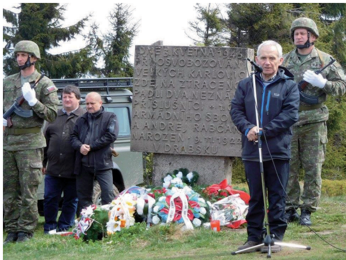
Rok čo rok sa na hrebeni Javorníkov stretávajú Česi a Slováci na spomienkovej slávnosti bojovníkov II. svetovej vojny.

sa v Pizzerii Lucia konalo otvorenie letnej sezóny, kde do tanca