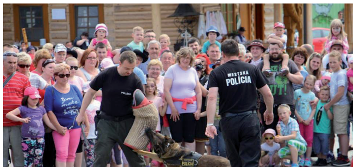
Bačova cesta na Kolibe prilákala návštevníkov. Pozornosti sa tešili aj ukážky poicajného výcviku psov.

a dobrej nálady zahrala country kapela Zálesáci.