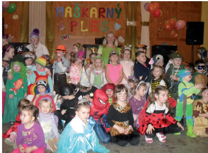
Maškarný ples v materskej škole.

sa v priestoroch KD a amfiteátra pri obecnom úrade uskutoční II. ročník folklórneho festivalu V srdci Javorníkov.