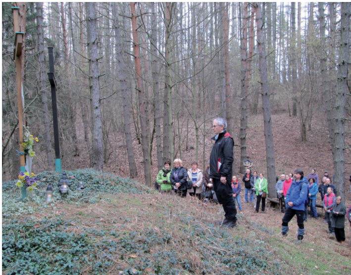
Počas pôstneho obdobia si veriaci z Papradna, Brvništa a Stupného vykonali pobožnosť krížovej cesty v Stupnom.