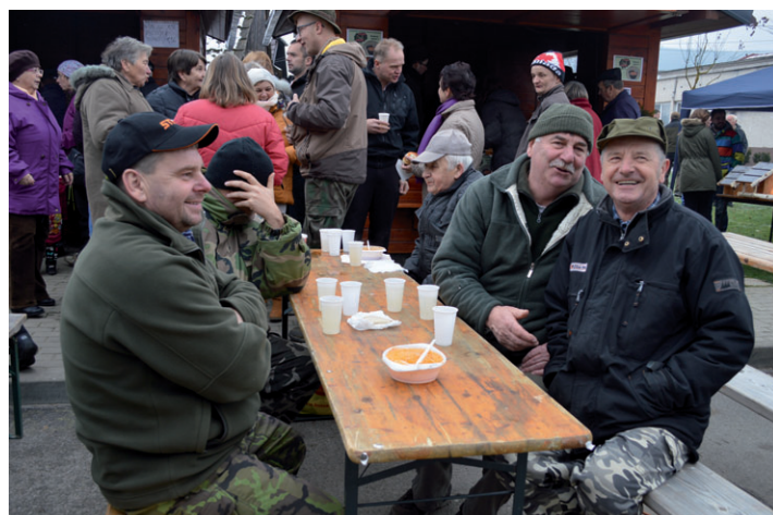
Sobotňajšia atmosféra na Ondrejovských hodoch.

sa postará DJ BO. O polnoci privítame Nový rok skvelým ohňostrojom.