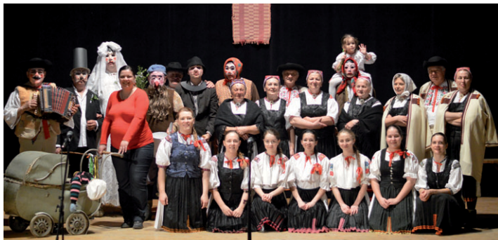
Zvykoslovné pásmo Šibačiarci, z ktorým FSK Podžiaran postúpila na celoslovenskú súťaž.