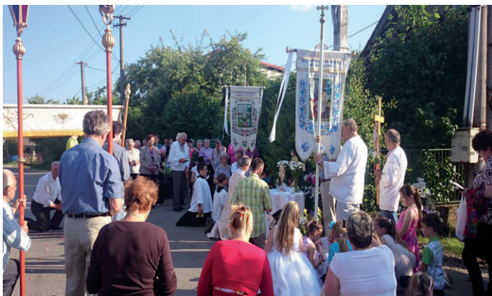
Začiatkom júna (4. 6.) na procesii po obci k sviatku najsvätejšieho tela a krvi Kristovej.