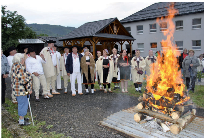
20. 6. - Folklórny festival V srdci Javorníkovo.