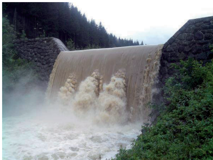
Papradňanska Stavnica počas májovej prietrže mračen.