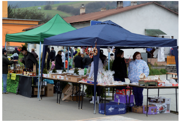
Ondrejovské hody v našej obci aj tento rok odštartovali skoro ráno už tradične pravou papradňanskou zabíjačkou, vyhrávala nám pri tom Dychová hudba Mošteňanka. Naším očiам ulahodili nádherné podomácky zhotovené výrobky.

Ďakujeme všetkým zúčastneným, organizátorom podujatia, sponzorom a v neposlednom rade aj tým, ktorí zareagovali na našu výzvu z minulého čísla Polazníka, a obohatili tak naše hodové slávnosti. Bolo výborne, tešíme sa opäť o rok! (dpm)