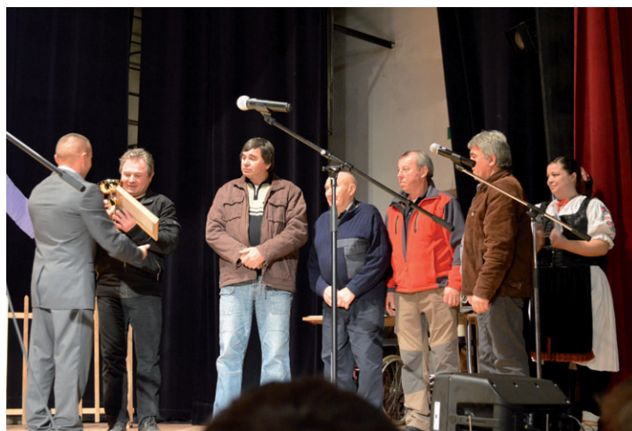
Zástupcovia turistov Papradna preberajú z rúk starostu obce ocenenie.