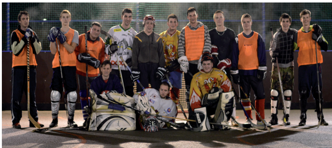
Naši hokejbalisti nezaháľajú ani počas zimných večerov a usilovne trénujú. Všetci dúfame, že sa ihrisko v zime premení na klzisko.

Trasa prechádzky: Štiavnická kaplnka, opekanie na Kopanici pri altánku, zástavka na kolibe a návrat domov.