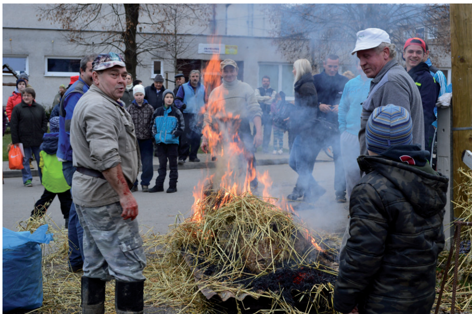
Tradičná papradnianska zabijačka s klasickým opaľovaním ošipanej v slame nechýbala ani na tohoročných hodoch. Viac na strane 5.

Ešte máme maličkú nádej na schválenie projektu zateplenia obecného úradu, ktorý som spracoval a stihol podať na Environmentálny fond. Budova by si už zaslúžila novú fasádu a aj rekonštrukciu strechy, nakoľko poškodené ostrešie a odkvapový systém