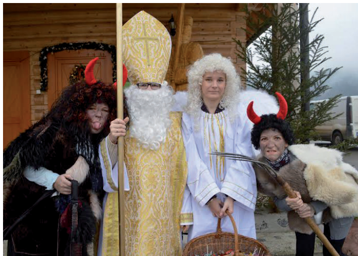
Mikuláš a jeho pomocníci na návšteve v našej obci.