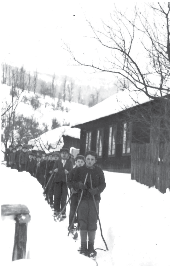
Fotografia je z lyžiarskeho výcviku žiakov (asi rok 1940) pri vtedajšej škole Podjavorníkom. Za ňou dnešné lyžiarske stredisko. V pozadí Javorníky.

Ten vrzgajúci sneh nemožno ničomu prirovnať. Hovorilo sa: „Ale vrzdí pod topánkami“.