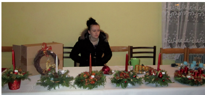
V nedeľu 8. decembra v kultúrnom dome bola výstavka vianočných ozdôb.