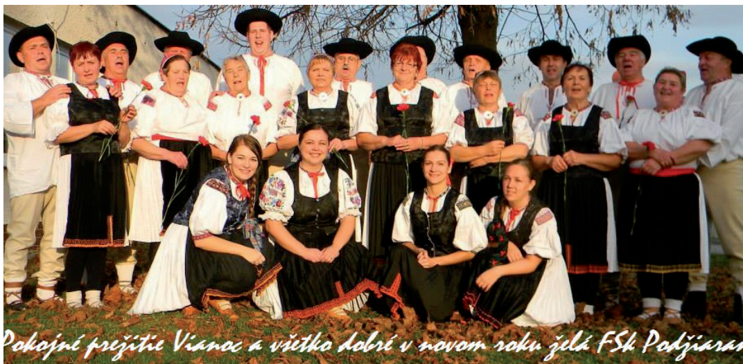
Pokojní prajete Vianoc a všetko dobré v novom roku žela FSK Podžiaran