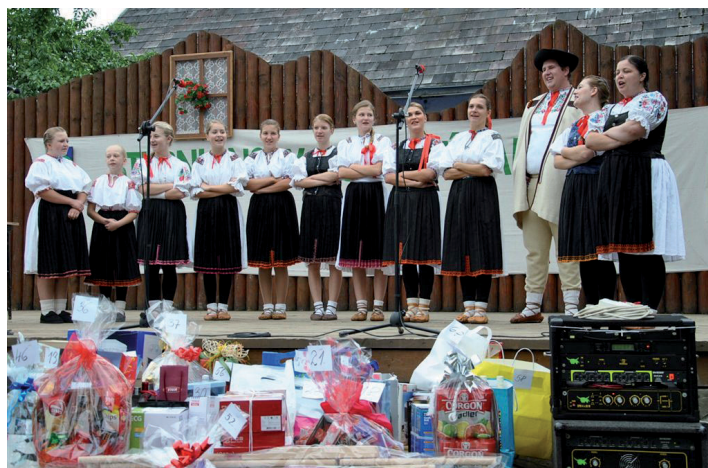
Podžiaran na Jasenickom nôtení.