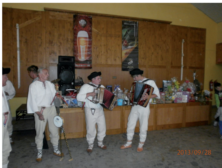
Na pivnom festivale prítomných zabávali aj harmonikári.