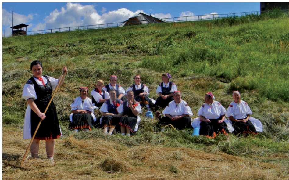
Členovia folklórnej skupiny Podžiaran mali v lete veľa vystúpení, prostredníctvom televízie šíria naše piesne po celom Slovensku. Viac na str. 7.

Všimli ste si ako naša obec opeknieva! Tam, kde je už vybudovaná kanalizácia je položený nový asfaltový koberec a hneď sa celá ulica zmenila na nepoznanie. Ale to by mal byť iba začiatok skrášľovania. Ten urobil obecný úrad. Nasledovať by malo odstraňovanie zvyškov stavebných materiálov z obecných pozemkov a ich skultivovanie. Tu môžeme pomôcť aj my. A to, aby sme si okolie našich domov, aj za hranicou nášho pozemku, skrášľili je už na nás. Nemusíme a nemali by sme čakať, že všetko urobia iba verejnoprospešní pracovníci (patrí im naše poďakovanie za ich doterajšiu prácu). Prispějme aj my, aby sme s radosťou a obdivom chodili po našom Papradne.