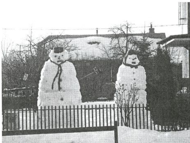
So snehom majú veľkú starosť, malí však veľa radosti.