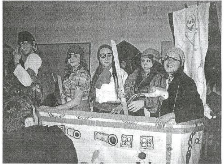
Masky na fašiangovej zábave.

Tento čas sme využili na zorganizovanie výstavy Čaro Veľkej noci. Výstavka bola ukážkou remesiel, spojená s predajom pletených košíkov, korbáčov, veľkonočných vajčiek, medovníčkov s motívom Veľkej noci, postavičiek zo šúpolia, rôznych veľkonočných ikeban a venčekov. Inšpirácií na prípravu výzdoby domácností bolo naozaj dost.