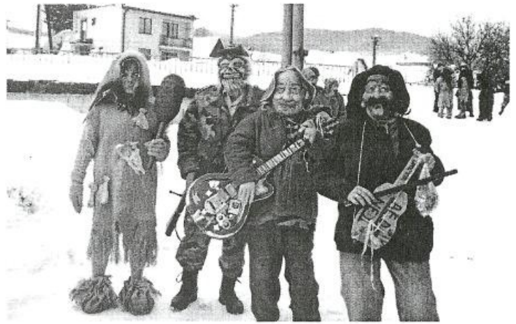
Fašiangový sprievod. Koniec fašiangov sa niesol v znamení veselosti, masky prešli dedinou a zábava pokračovala v kultúrnom dome.

o 18.00 hodine sa stretneme pri válení mája.