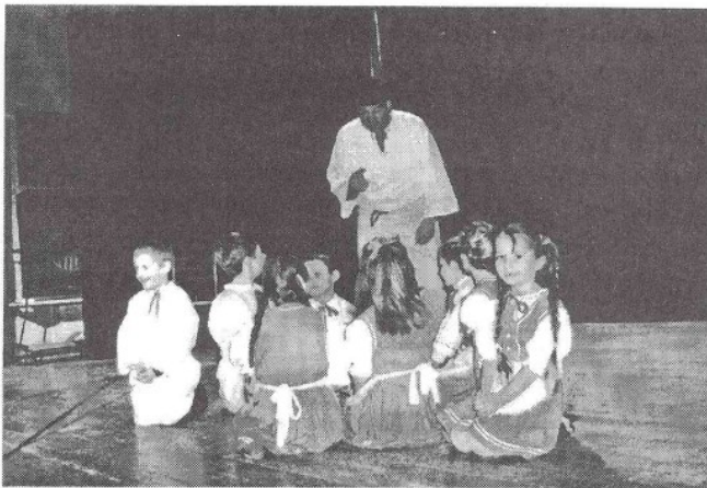
25. výročie založenia folk.skupiny Podžiaran

slávnostný koncert žiakov ZUŠ pri ZŠ Papradno o 15.00 hod. v kinosále KD.