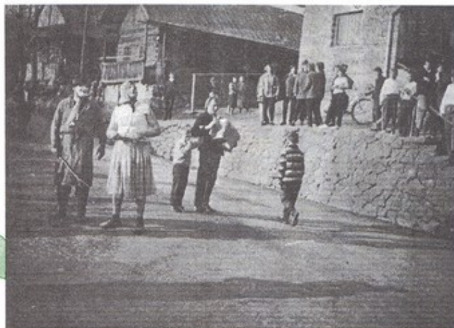
Šibáky v roku 1965

Kvitnúce kríky, napr. zlatý dážd, striháme na jar po odkvitnutí, aby si krík vytvoril dostatok nových výhonkov, ktoré budú na ďalšiu jar opäť kvitnúť.