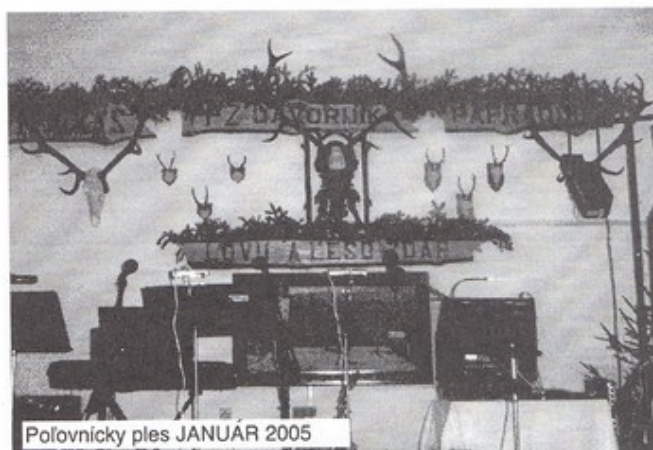
Poľovnícky ples JANUÁR 2005