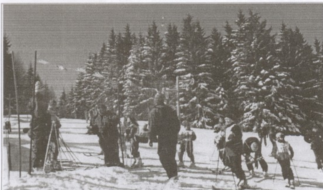
Pracovníci obecného úradu i zastupiteľstva vyvinuli nemálo úsilia, aby po dvoch sezónach ožil lyžiarsky ruch v známom stredisku Papradno – Podjavorník. Dúfajme, že nebude dlho trvať a podmienky v ňom sa budú z roka na roky vylepšovať. Výsledky snaženia si budú užívať najmä ďalšie generácie. - vp -

Január Založenie prípravného výboru klubu Február Turistika Papradno – Podjavorník (pešo + bežky) Náborové preteky záujemcov o zjazdové lyžovanie Marec Účast na kultúrnej akcii v lyžiarskom stredisku Podjavorník Apríl Vyhľadanie kameňa na osadenie na náučný chodník cez hrebeň Jarovníkov Osadenie tradičného mája pred Obecným úradom v Papradne, májová veselica Máj Osadenie kameňa na hrebeni Javorníka, časť Bukovina Osadenie tabúl k náučnému chodníku Účast na príprave tradičného stretnutia Moravanov a Slovákov na Javorníku pri Troch krížoch, zabezpečenie slávnostnej vatry Cyklistická akcia (trasu určia cyklisti) Jún Čistenie turistických chodníkov Tisová – Javorník 1. ročník výstupu na HOLÝ VRŠOK