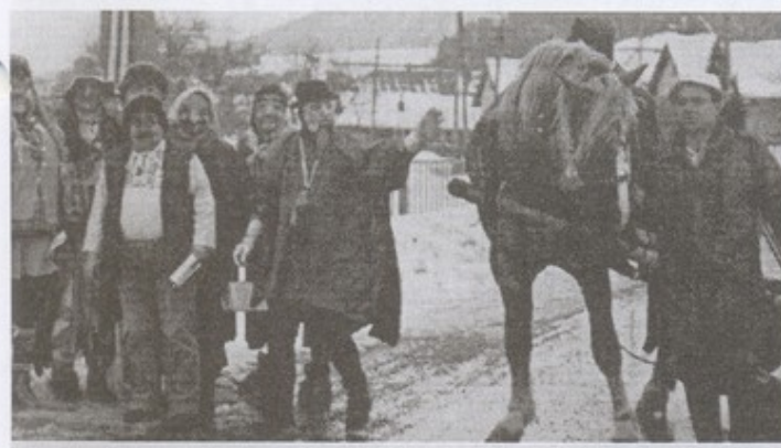
Fašiangový sprievod tiahol obcou a skončil v kultúrnom dome.

Pofovňé združenie JAVORNÍK usporiadalo 31. januára 2004 svoj prvý ples. Prišli naň nielen pofovňáci, ale aj ostatní z obce a všetkých organizátorov milo prekvapili – výzdobou, tombolou, príjemnou atmosférou. Hostia sa im odvdáčili tak, že sa bavili až do rána.