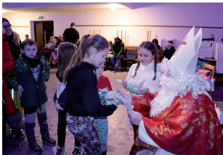
Mikuláš v kultúrnom dome.

sa o 23.00 hodine stretne pri obecnom úrade a amfiteátri na spoločnom ukončení starého roka a uvítaní nového .