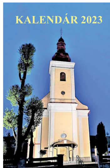
Kalendár na rok 2023 vás čaká v ZŠ s MŠ a OÚ Papradno.