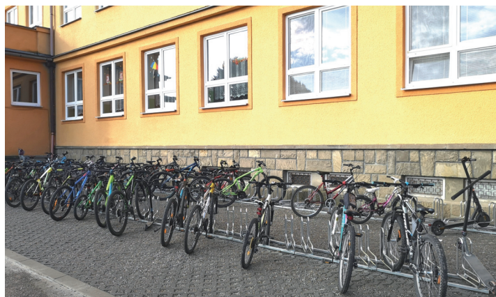
Nové parkovisko pre bicykle.