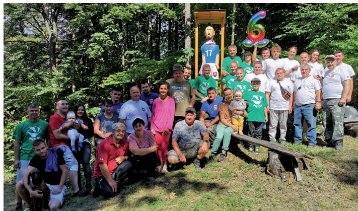
Futbalový turnaj osadníkov v Medvedzém tento rok opäť na výbornú!

Naši turisti spoločne s turistami z Jasenice navštívili od 30. augusta do 4. septembra severné Taliansko – Ponte di Legno, región Lombardsko.