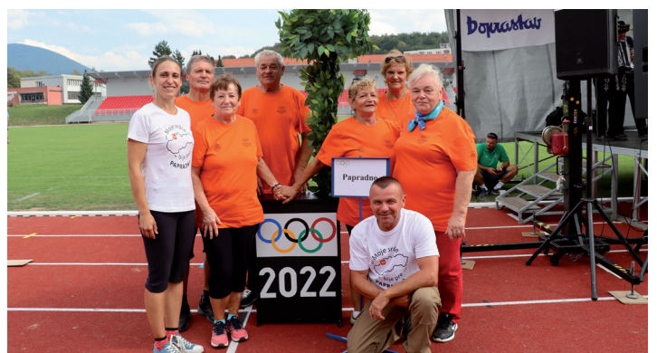
Seniori na olympiáde.