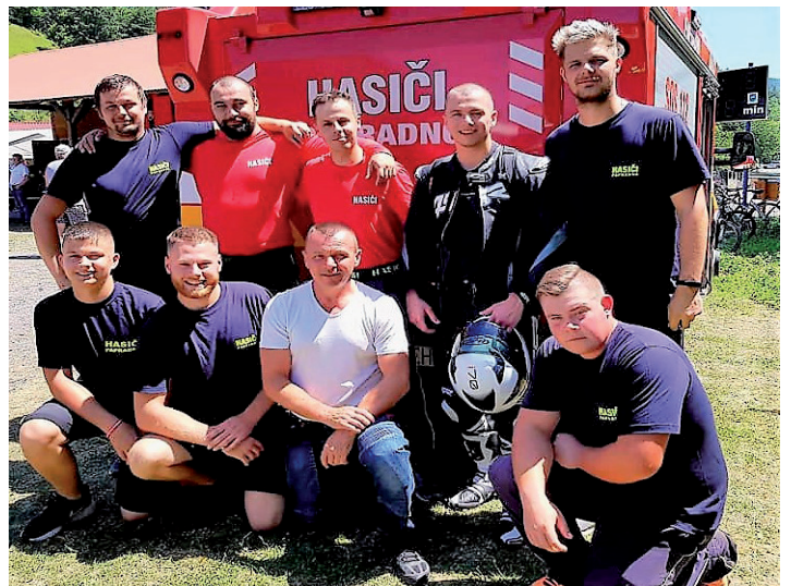
Členovia DHZ Papradno absolvovali v júli v Dolnej Marikovej previerku pripravenosti.

vyzývame občanov, aby do kontajnerov nedávali vytriediteľný odpad, konáre, trávu, kamene ani pneumatiky!