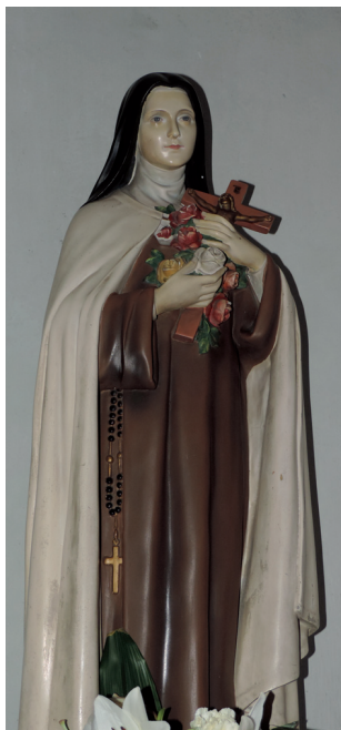
Socha sv. Terezy Ježiškovej