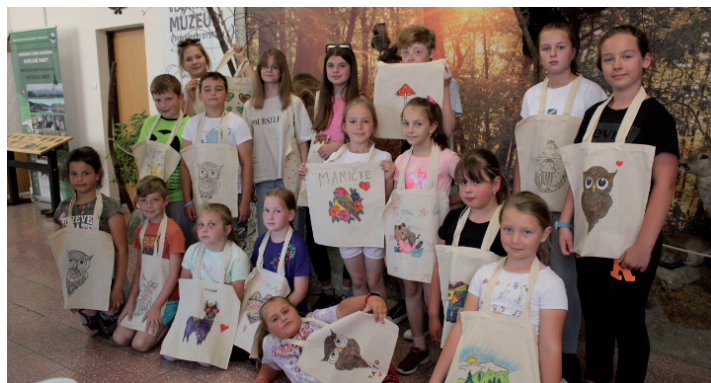
Podžiaranček v múzeu.

V dňoch 9. až 11. augusta 2022 sa zúčastnilo šesť detí z Podžiarančeka Letnej hudobnej školy DOBROHUDIE 2022 v Pružine. Deti tu počas troch dní nadobúdali nové skúsenosti v hre na šesťdierkovú, koncovú a rífovú písťalu, husle a drumbľu. Božena Bašová