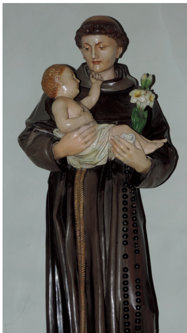
Socha sv. Antona Paduánskeho