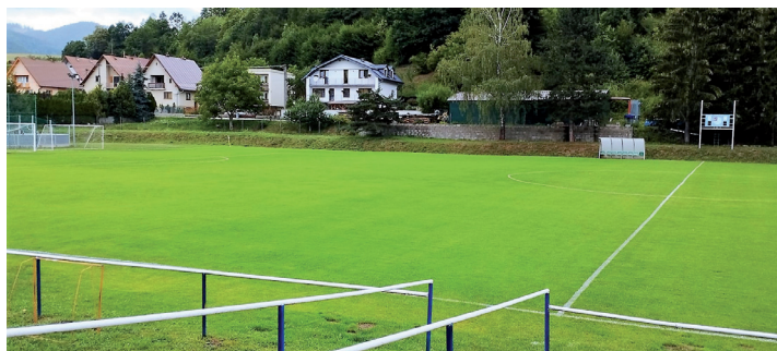
Zrekonštruovaná trávnatá plocha TJ Žiar Papradno.