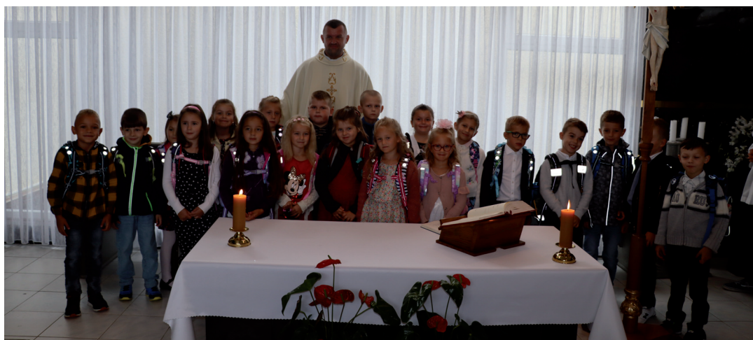
Posvätenie prváčkových tašiek.