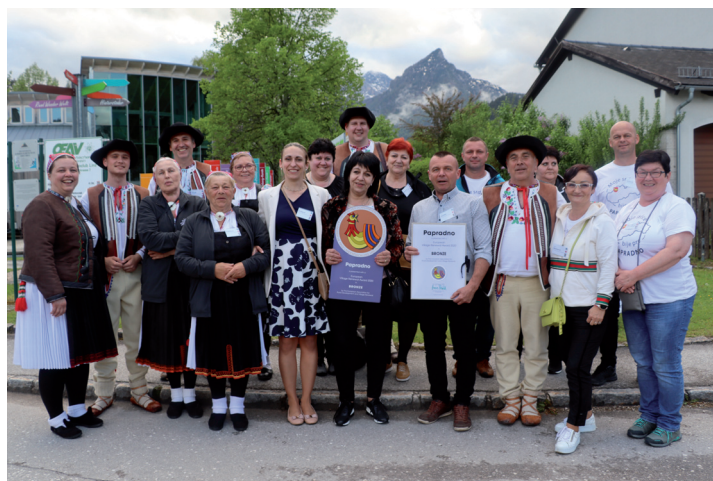
Európska dedina roka 2020.