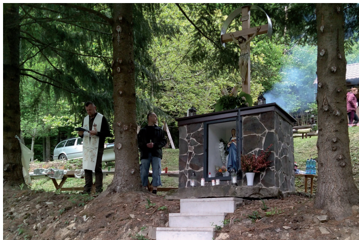
Kaplnka U Harváňko (Podjavorník).

Ježiš počas svojho života na zemi prikazuje svojim dvanástim učeníkom: „K pohanom nezabúčujte a do samarijských