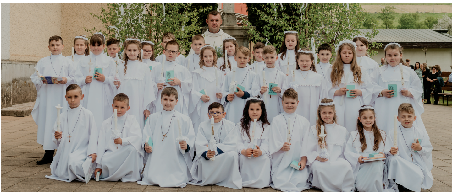
15. mája pristúpili deti z Papradna a Brvništa vo farskom kostole k prvému svätému prijímaniu.

V jarných mesiacoch sa v bývalej hornej materskej škole organizovala Burza oblečenia. Záujem o ňu bol mimoriadny. Pripraviť, prebrať a porozkladať prinesené oblečenie je časovo náročné, ale vďaka ochotným ženám zvládnuté vždy veľmi dobre. Nakoľko sa burza uskutočňuje v zatiaľ nevyužívaných priestoroch škôlky, môže sa konať častejšie. V tomto roku sa plánuje zber oblečenia v septembri, a tak následne by mohla opäť otvoriť svoje brány pre širokú verejnosť v dňoch 29.9. – 1.10.2022. O presnom termíne budete včas informovaní.