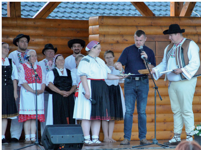
V srdci Javorníkovo.