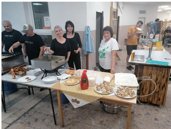
10 rokov M – Baru Papradno.

Termíny budú upresnené prostredníctvom plagátov a v miestnom rozhlase.