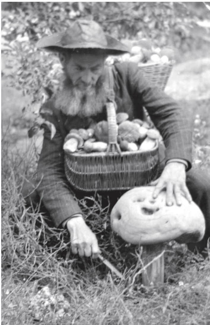
Putaj z Podžiaru na hubách