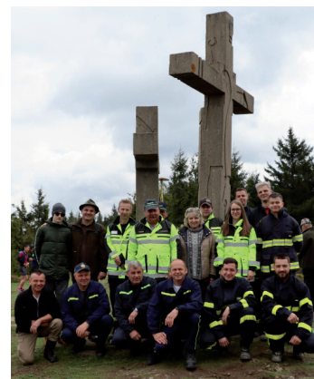
Oslavy na Stratenci.