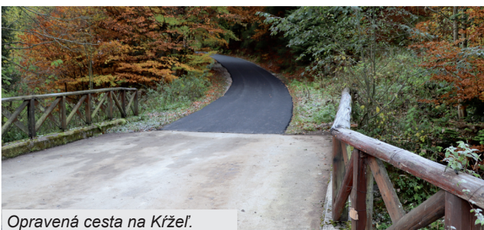
Opravená cesta na Krížel'.