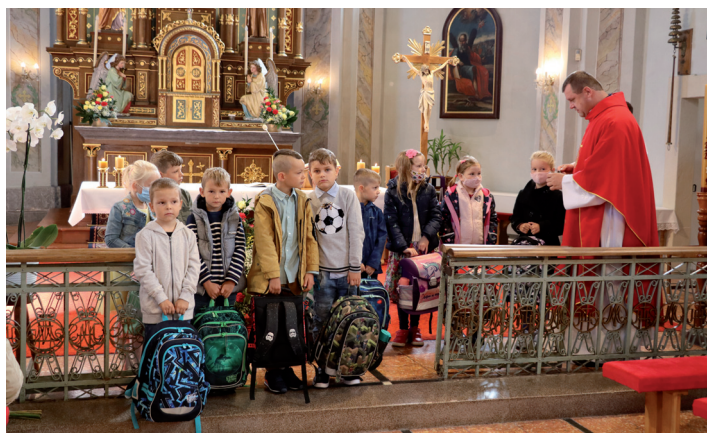
Na sv. omši 2. 9. požehnal prvákom pán farár školské tašky.

Ale leto nebolo len o festivaloch. Bolo aj o našich stretnutiach na množstve skúšok, ešte väčšom počte omší v kostole, ale našli sme si čas aj na varenie segedínskeho guláša v Dalase a hlavne na deviaty a desia-