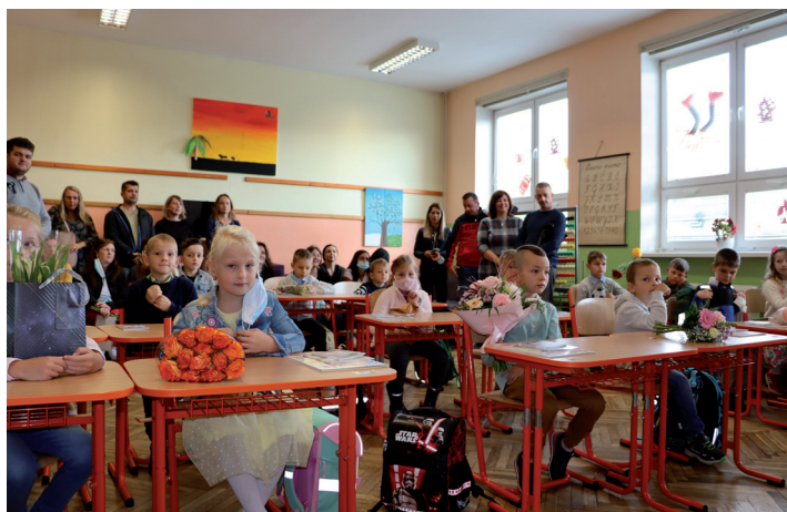
Prvýkrát v školských laviciach.