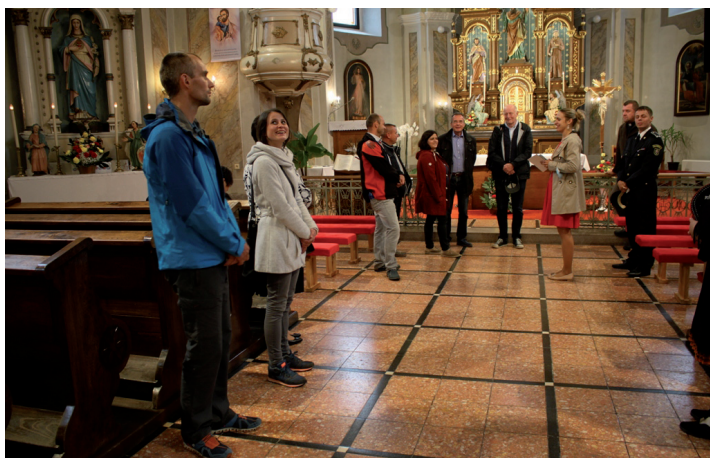
Komisia na návšteve v kostole.