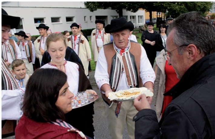
Hodnotiaca komisia prichádza do Papradna.

Slovenská republika má v súťaži o Európsku cenu obnovy dediny 2020 svoje železko v ohni. Je ním obec Papradno ako víťaz národného kola súťaže Dedina roka 2019. Pre pandémiu koronavírusu museli byť návštevy obcí bojujúcich o tento titul odložené. Papradno navštívila európska hodnotiaca komisia 1. septembra. V súčasnosti porota dokončuje návštevy ostatných zapojených obcí. Záverečné stretnutie sa uskutoční v októbri tohto roku. To, či obec zaujala porotu natoľko, aby získala ocenenie, sa dozvieme na slávnostnom vyhlásení výsledkov v hornorakúskej obci Hinterstoder na jar 2022.