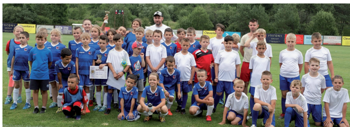
Žiaci na turnaji v Brvništi.