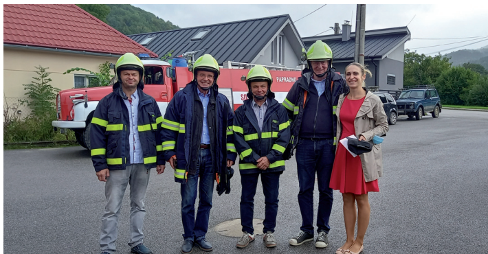
Členovia komisie v zásahovom oblečení sa previezli v hasičskom aute po dedine.