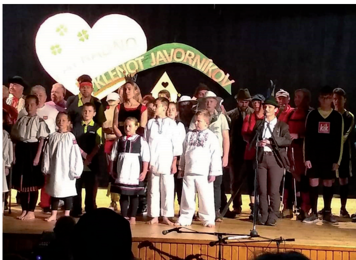
FSk Podžiaran a zložky pôsobiace v obci zaujali kultúrnym programom.