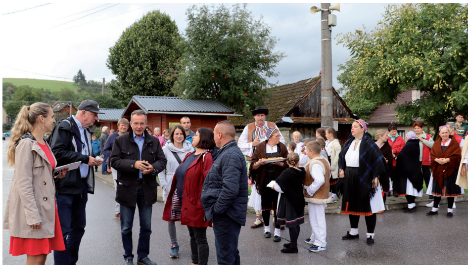
Vítanie hodnotiacej komisie Európskej dediny roka.

Začal nám krásny jesenný čas, kedy zberáme úrodu našej práce. Tešíme sa na slnečné jesenné dni s farebnými listami stromov, červenými šípkami a možno aj d'alšou nádielkou húb. A úrodu šikovnosti našich ľudí sme si mohli pozrieť v kultúrnom dome pri návšteve hodnotiacej komisie Európskej dediny roka. Bolo sa na čo pozerat' a som hrdá, že v Papradne je toľko šikovných ľudí. Nebuďme skúpi na ocenenie či pochvalu tých, ktorí si to zaslúžia – či už na verejnosti, ale chváľme i našich najbližších v rodine. Slovíčka: d'akujem, to si dobre urobil, si šikovný povzbudia aj potešia a mali by sme ich používať často.