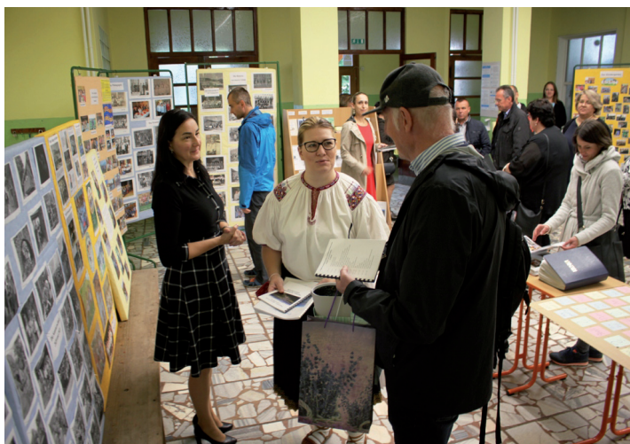
Po prehliadke ZŠ a MŠ nás potešili slová jedného z porotcov: Die Schule ist SUPER!"