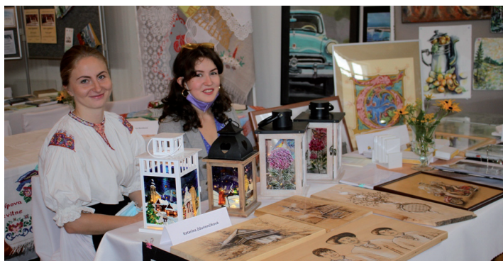
Prezentáciu aktivít remeselníkov a zaujímavostí obce si hodnotiaca komisia i naši občania prezreli v sále kultúrneho domu a ochutnali aj špeciality, ktoré pripravili naše šikovné ženy.