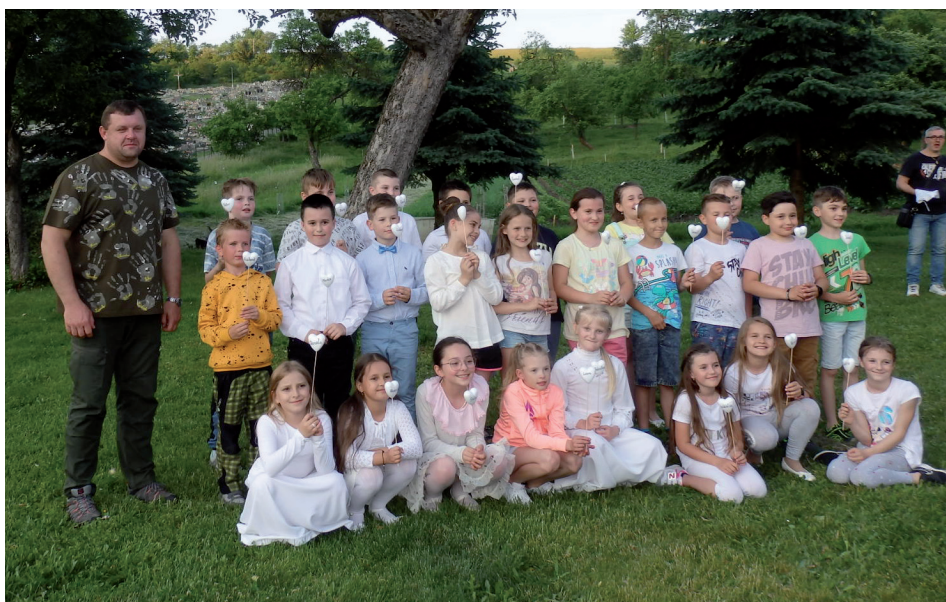
Prvoprijímajúce deti u pána farára v záhrade.

asfalt boli minimálne a asfalt na nej vydrží dlhé roky. Cesta k nim bola iba hlina, je pod horou, podmoká a keby sa mal dať asfalt, tak príprava podložja s drenážou by niekoľkonásobne predražila túto slepú uličku. Obľúbená je u niektorých občanov fráza – „ved si platím dane“. Tak som im prerátal cenu prístupovej cesty k nim a vyšlo nám, že by na ňu našetrili za 1000 rokov. Sebeckosť, závisť a zákernosť vytláča z našich životov vzájomnú toleranciu, úctu a sebareflexiu.