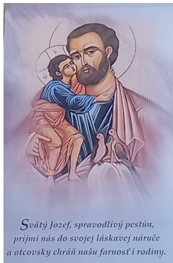
Svätý Jozef, spravodlivý pestún, prijmi nás do svojej láskavej náruče a otcovsky chráň našu farnosť i rodiny.

Sebaľútosť, vykazovanie sa v lepšom svetle, hľadanie príčin, prečo sme tak konali. Miesto toho, aby sme hľadali riešenie, hľadáme príčiny. Miesto ospravedlnenia sa a priznania svojej chyby hľadáme vinníka. A ak sa už ospravedlníme, tak jedine len osobe, ktorej sme ublížili. Znova nastupuje pýcha. Už roznesenú klebetu neodvoláme pred tými,