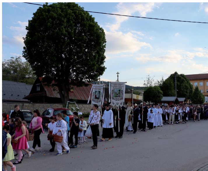
Sprievod veriacich zo sv. omše na Božie telo od amfiteátra ku kostolu.