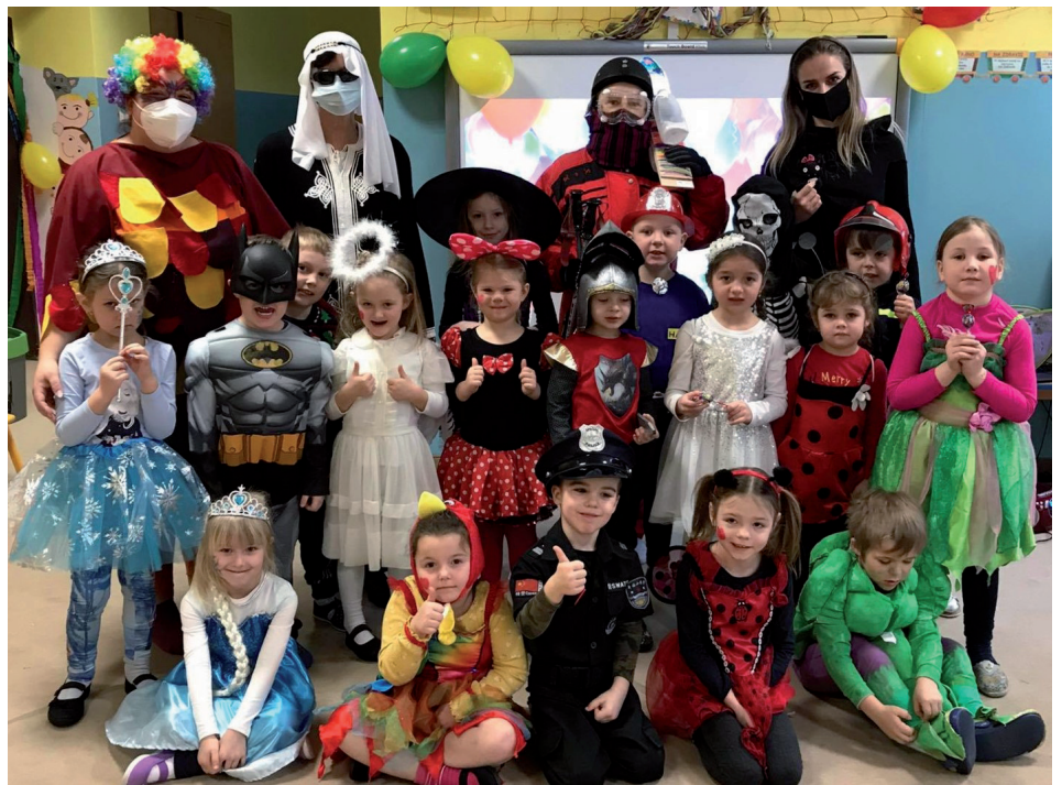
Na karnevale v triede sa tento rok zabávali len deti z MŠ.

Želáme vám pokojné prežitie Veľkej noci.