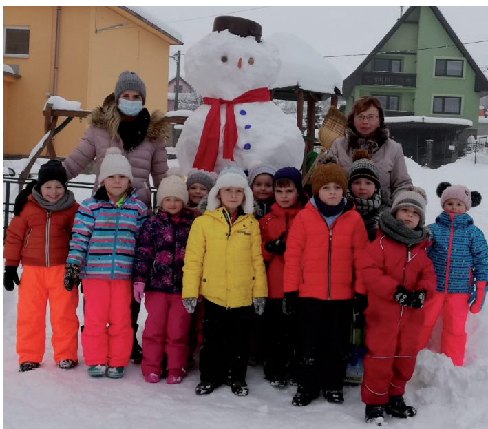
Aha, veď ten snehuliak je väčší ako naša pani učiteľka.