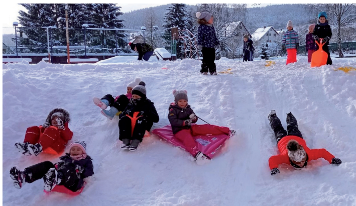
V zdravom tele zdravý duch.