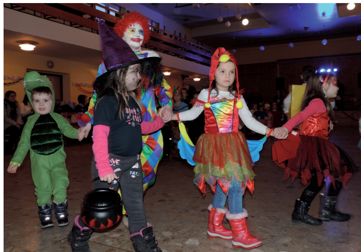
Karneval detí MŠ.

Opravím šijacie stroje, Anton Lališ, č.t.: 0948/045 424