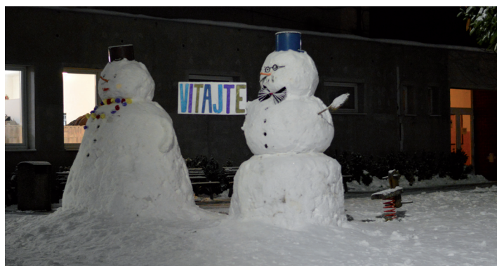
Hosti rodičovského plesu vítal netradičný pár-obrovský snehuliaci, ktorých postavili naši deviataci.