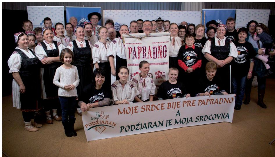
FSD Podžiaran vo folklornej súťaži Zem spieva, viac sa dočítate v budúcom čísle Polazníka.

Jar je krásna, ale prináša so sebou aj nechcenú jarnú únavu. Najjednoduchší spôsob, ako ju premôcť, je pohyb na čerstvom vzduchu, strava plná vitamínov a striedanie studenej a teplej sprchy. A v žiadnom prípade nesmiete zabudnúť viac sa usmievať, lebo s úsmevom je všetko ľahšie a krajšie. (mb)